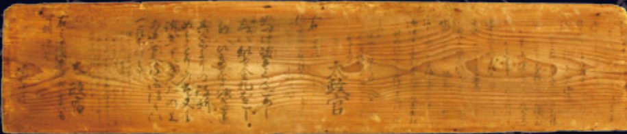
明治3・5年太政官高札