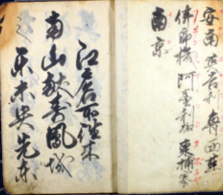
国尽異国名江戸名所手本