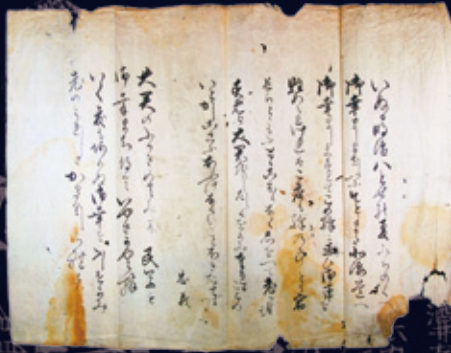
演野弥右衛門献詠歌